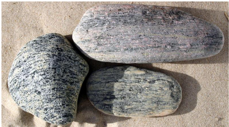
Figur 7 Metamorfe bjergarter - her Gnejs

Herudover kan nævnes marmor, kvarsit og ambifolit.