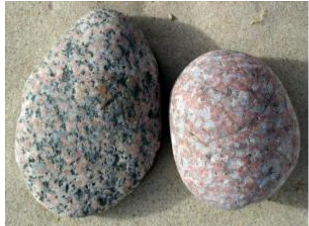
Figur 1 Dybbjergart - granit