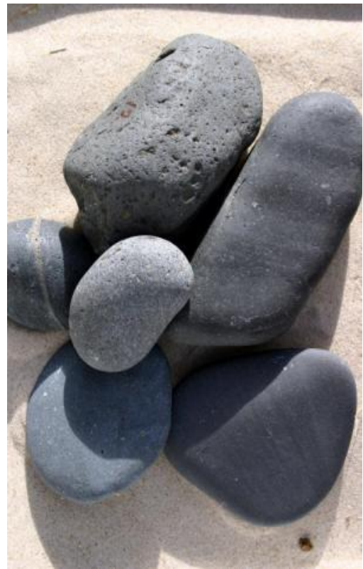
Figur 2 Dagbjergart - basalt

En gruppe af de magmatiske dagbjergarterne kaldes 'porfyr'. Porfyr har en grundmasse af fine korn, hvori der ligger større tydelige korn , ofte af anden farve. Porfyrene udgør også undtagelsen fra reglen om at magmatiske bjergarter ikke har sribning. Mineralerne kan ligge i bånd / striber i porfyren