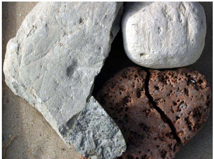
Figur 4 Kalksten

En gruppe af sandsten er konglomerater, hvor man med det blotte øje kan se større afrundede mineralkorn