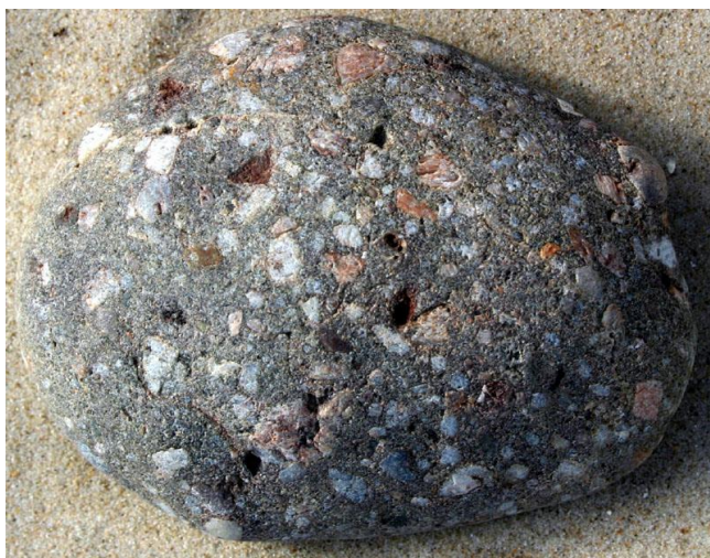
Figur 6 konglomerater