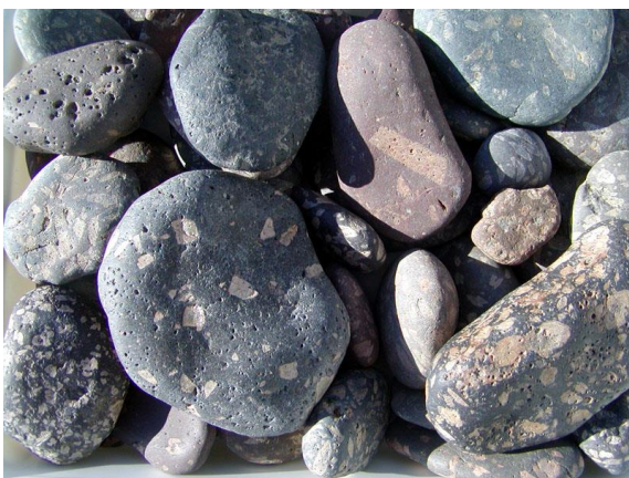
Figur 3 rhombeporfyrer

Her er de enkelte mineralkorn ikke synlige uden brug af lup. De finkornede magmatiske bjergarter kaldes også for dagbjergarter.